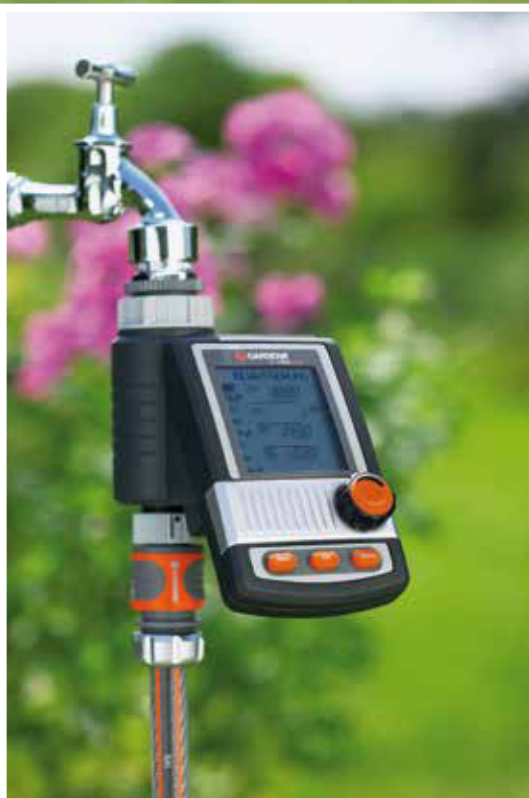
Text: Redaktion/Text-Quelle und Fotos: GARDENA

Es gibt smarte Typen, smarte Outfits, smarte Stadtflyter – und ab sofort auch smarte Gärten. In einem smarten Garten sorgen aktuelle Technologien für die optimale Pflege der grünen Lieblinge. Und das jederzeit und von jedem Ort der Welt aus.